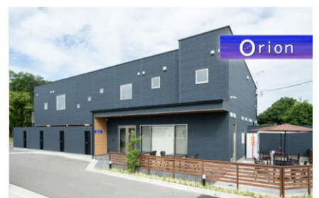
合宿型宿泊施設風景(全棟貸切)